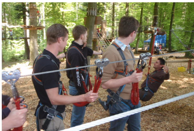
Eingehakt und zum Erklimmen der Lüfte bereit: Die Mitglieder der OG Aarau im Waldseilgarten Rütihof.

Viele hatten schon davon gehört, dass es auf dem Rütihof bei Gränichen etwas ganz besonderes zu erleben gibt, doch nur wenige waren schon dort um sich der Herausforderung Waldseilgarten zu stellen. Bei optimalen Meteobedingungen versammelten sich am 30. April knapp zwanzig Mitglieder, um sich auf genau dieses Abenteuer einzulassen. Nach einer umfassenden Einweisung (nach dem Motto "Vormachen, Mitmachen, Nachmachen") und Fassung der Ausrüstung, stiegen wir in den Klettergarten Rütihof ein. Alle Teilnehmenden konnten dabei nach eigenem Ermessen die verschiedenen schwierigen Parcours absolvieren und ganz nach Belieben klettern, schwingen, springen, balancieren oder einfach nur den wunder-