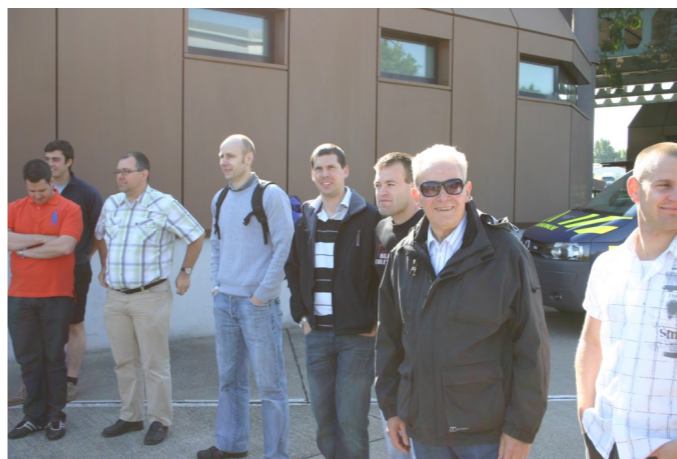
Generationenübergreifende Schar von Offizieren der OG Aarau zu Besuch beim Grenzwachtkorps in Basel.

Staatsgebiet und wenn man die falsche Einfahrt zur Schweizer Infrastruktur nimmt, dann landet man in Deutschland. Nach einer Querung sämtlicher Autobahnspuren auf deutscher Seite und einigen fragenden Blicken erreichte auch der zweite Schweizer Militärtransporter seinen Bestimmungsort. An drei verschiedenen Posten wurden