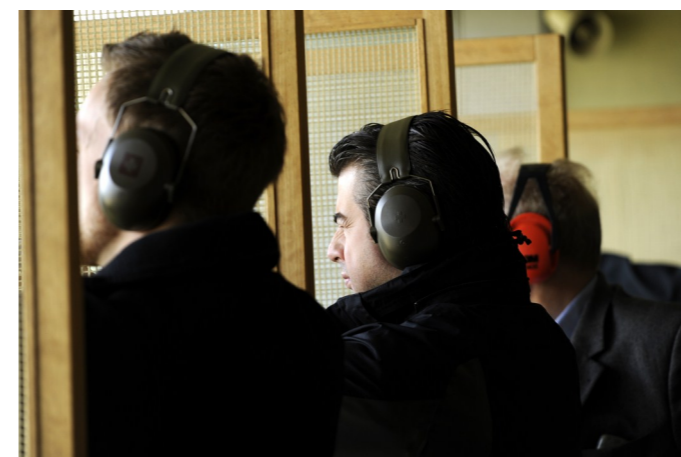
Alle Scheiben besetzt, alle Munition verschossen. Das traditionelle Standschiessen war ein voller Erfolg.

mandogebung ist das A und O für den effizienten Schiessbetrieb. Die Schiesskadenz auf der neuen Anlage ist wesentlich höher, als noch mit der alten Methode, bei der sich das Ablesen, Kleben und Feilschen um angerisene 10er oft über Minuten hinzog. Genau das richtige für Schiesshungrige. Keine zwei Stunden später waren die 1'200 Schuss sauber in der Kugelfanganlage versorgt. Beim Rangverlesen bestätigte sich ein klares Bild. Die geübten Schützen konnten die besten Resultate verbuchen, wobei die meisten Teilnehmer gute Resultate erzielten. Gut gepflegt von der Schützen-