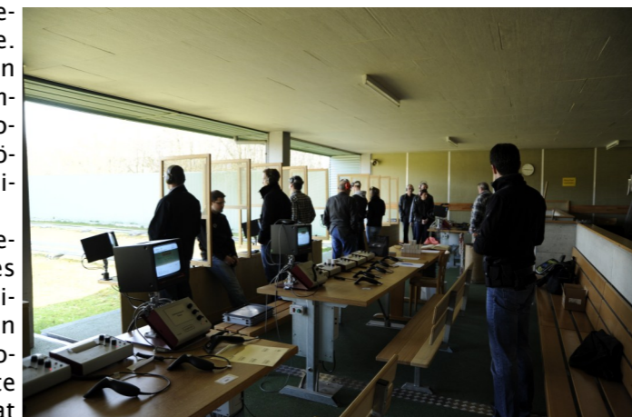
Die neue elektronische Pistolenschiessanlage im Lostdorf Buchs. Ein Volltreffer für die Schützen der OGA.

nem Glanzresultat zu verhelfen. Auch die Tücken und Eigenheiten der elektronischen Scheiben und der Steuerung forderten so manchen Schiessleiter heraus. Eines steht fest, die Bedienung der Anlage muss gelernt sein. Die Komische Scheibe und der sicheren Handhabung der Waffe.