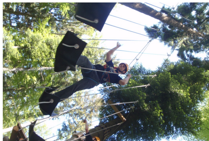
Mit sicherem Tritt nahe an den Baumwipfeln. Die Herausforderungen waren mannigfaltig...

schönen tiefgrünen Frühlingwald aus besonderen Perspektiven geniessen. Schnell war zu spüren, welche Mitglieder bereits über entsprechende Erfahrungen verfügten und auch den nötigen Mut mitbrachten um sich bis auf die höchste Schwierigkeitsstufe vorzuarbeiten. Andere wiederum agierten nicht so wagemutig und waren eher