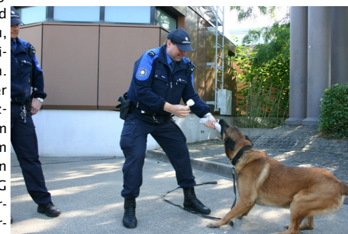
Das anspruchsvolle Training mit dem Sprengstoffhund. Wenn es sein muss, beisst er auch...

den OGAern in einer ersten Phase die Einsatztechniken der Grenzwächter näher gebracht. Eine mobile Gepäckkon- trollanlage mit Röntgenapparat kann einen Reisebus innert 2 Stunden kon- trollieren, wird aber auch im Transit an Flughäfen eingesetzt. Das mobile Dro- genlabor kann kleinste Mengen von Drogen auf Gegenständen nachweisen. Gemäss dem Experten des GWK sind praktisch alle unsere Banknoten kontaminiert! Auch die Fahrzeuge und das Einsatzmaterial wurden präsentiert. Das Polycom mit eigenem Kanal ist Standard. Eindrücklich ist die gezeigte Arbeit mit dem Diensthund. Trainiert auf Sprengstoff und auf die Personenfahndung überzeugte dieser uns mit seiner Disziplin und seinem Können. Das Dach über den praktischen Vorführungen bildete eine Präsentation zur Situation und Geschehen im Schengenraum und die Neuordnung der Aufträge für das Grenzwachtkorps. Zum anschliessenden Mittagessen im Restaurant Rheinhafen hatte sich ein gesunder Hunger angesammelt. Die bestellten Cordon-Bleu waren doppelt so gross wie die Teller darunter. Also gerade richtig! Marc Gugelmann